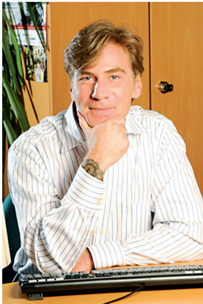
Mesmo com tanta desventura, ninguém pode dizer que ele não ‘viveu’

Livro Memórias do Submundo, de Rodger Klingler. Editora Best Seller, tradução de Elena Gaidano, 2008. ASDBN