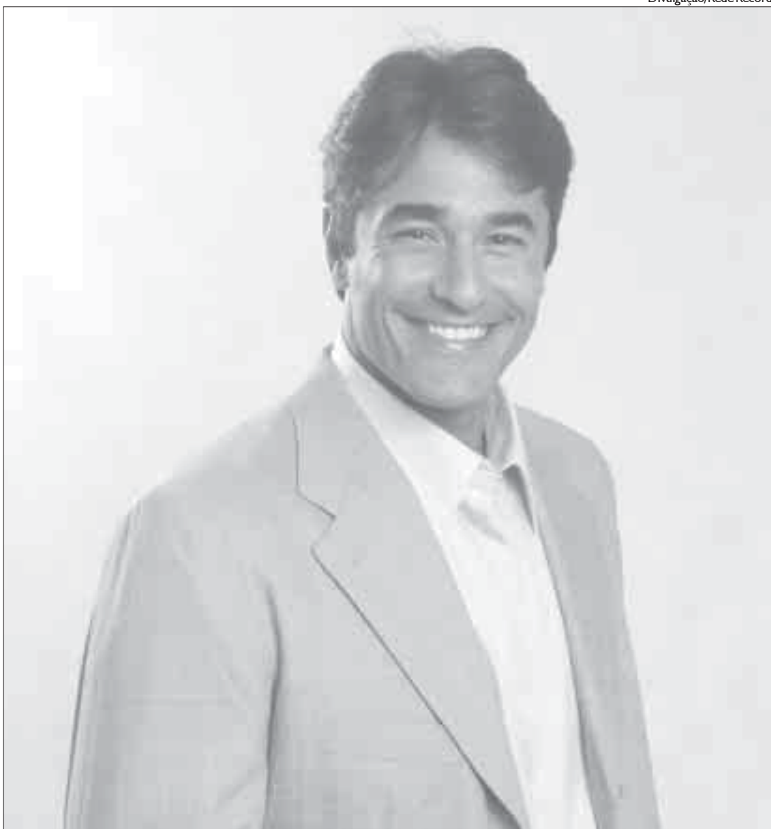
Szafir encarna dois irmãos gêmeos em seu terceiro papel na rede Record de televisão

Apesar de estar na Record, mais uma vez como par romântico de Renata Domingues, o ator não tem receio de cair na repetição