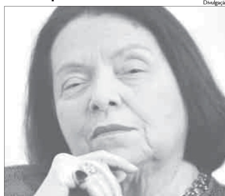
Nélida vai falar sobre a carreira e sobre suas obras

Nélida nasceu no Rio de Janeiro, em 1937. Formada em jornalismo, ocupa a cadeira número 30 da Academia Brasileira de Letras (ABL). Em mais de cem anos de existência da Academia, foi a primeira mulher a integrar a diretoria e a presidir a ABL. Em 2005, foi a primeira escritora de língua portuguesa a receber o Prêmio Príncipe de Astúrias (Espanha). É autora de cerca de 20 livros, entre os quais Vozes do Deserto , A Casa da Paixão e A República dos So-