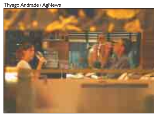
Regina Rito Agência O Dia