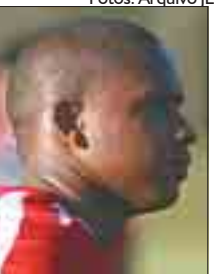
Valencia volante, 24 anos Paranaense 2009: 12 jogos / 0 gol Seleção JE: 6,05 (10)