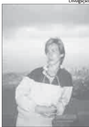
O jovem Rodger, em 1980

Os momentos cinematográficos vão além. Como o encontro com o delegado que ainda tinha restos da cocaína pura apreendida nas narinas. E apenas metade do quilo que tentava levar para a Alemanha es-