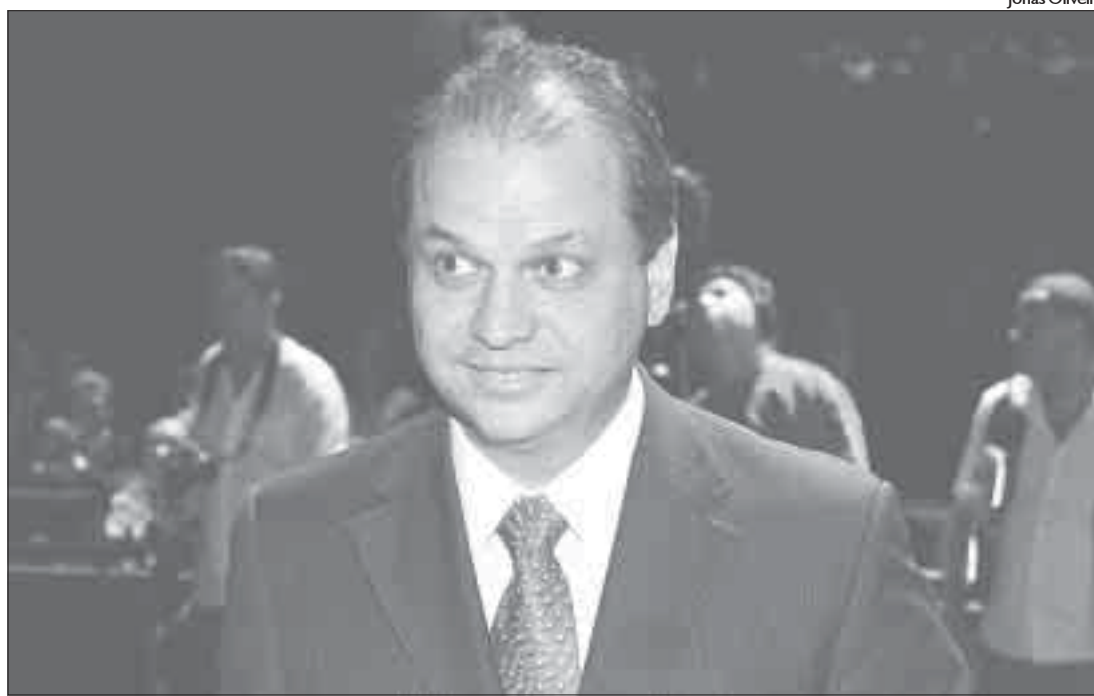
O deputado federal e vice-líder Ricardo Barros (PP): "A decisão está nas mãos do PSDB"

"O Ricardo Barros só tem o direito de pedir ao PT para definir. Ele é aliado do PT", reforçou o presidente estadual do PSDB, deputado Valdir Rossoni.