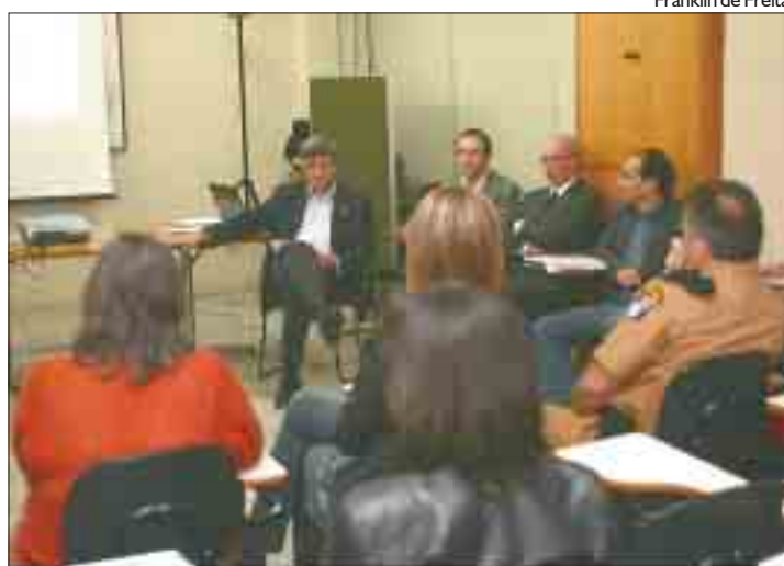
Reunião uniu Saúde, Anac, Anvisa e Secretarias de Estado

Medida provisória vai liberar R$ 141 milhões para o trabalho de prevenção da Influenza A no País