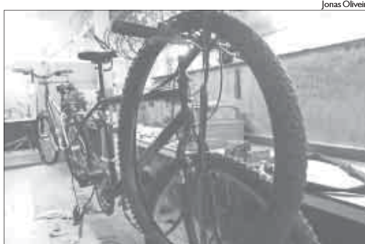
Bicicletas usadas diariamente exigem manutenção mensal

Com isenção de PIS/Cofins, 799.669 motoqueiros e ciclistas poderão ser beneficiados no Paraná