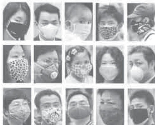
MODA? — Obrigados aos uso da máscara por causa da gripe suína, chineses inventaram nova moda.