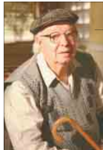
Willian Andrade/TV Globo