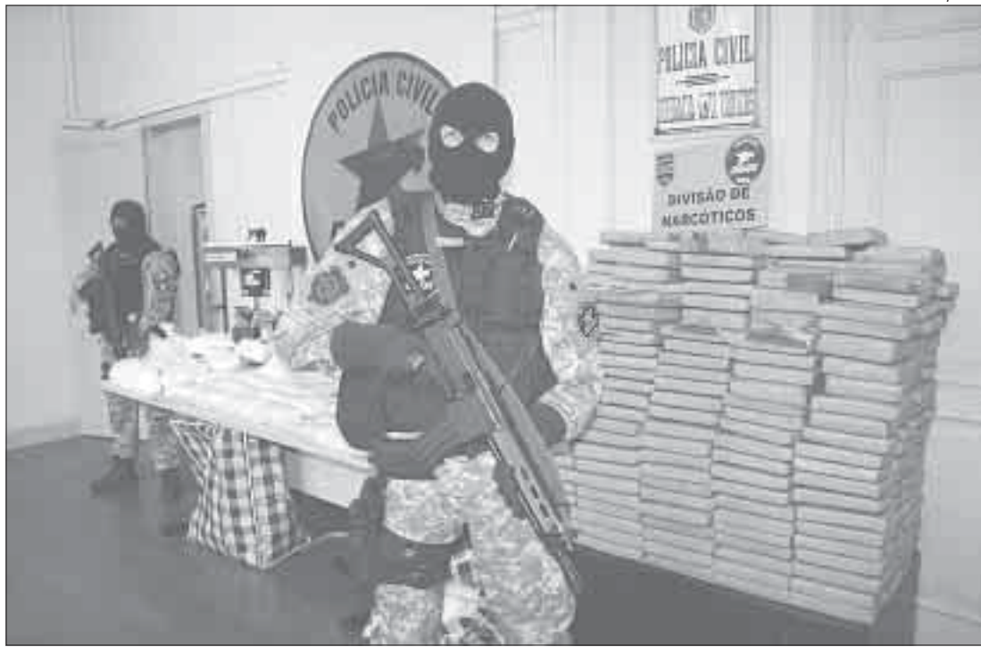
Drogas e materiais usados no laboratório foram trazidos para Curitiba, onde serão destruídos

As apreensões são as maiores já realizadas pela Divisão Estadual de Narcóticos desde a sua criação, em 2007. As investigações vão ser intensificadas para a localização de outros membros da quadrilha.